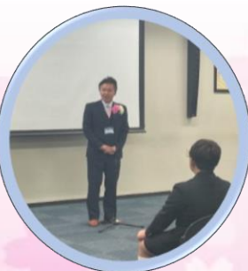
卒業生保護者代表