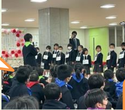
縦割りカラーのバンダナもつけて、縦割り班の仲間入りをしたよ！