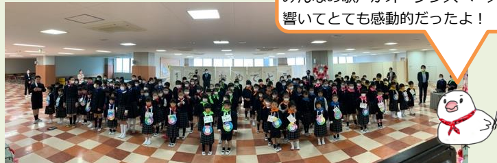
全体合唱「音楽のおくりもの」は、みんなの歌声がオープンスペースに響いてとても感動的だったよ！