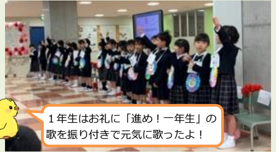
1年生はお礼に「進め！一年生」の歌を振り付きで元気に歌ったよ！