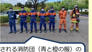
「ボランティアで形成される消防団（青と橙の服）の協力無しでは、素早い消火活動は成り立ちません。」(消防士さん)