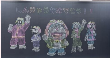
しんきゅうおめでとう！！