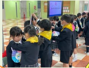
2年生からメダルのプレゼントを首にかけてもらった1年生、嬉しそうね！