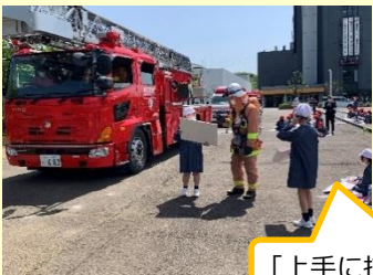
「上手に描いてくれたね！」